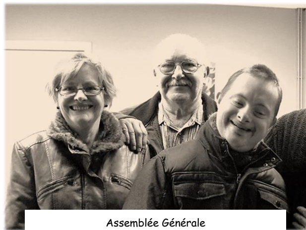
Assemblée Générale du 29.03.2015