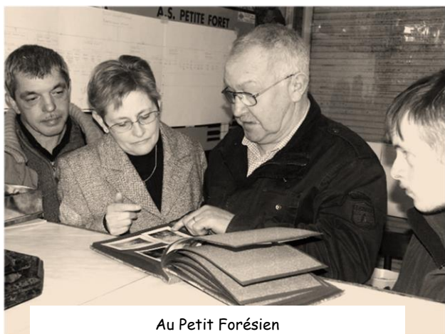
Au Petit Forésien le 18.03.2008